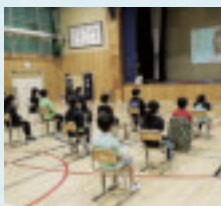
釧路市立山花小学校