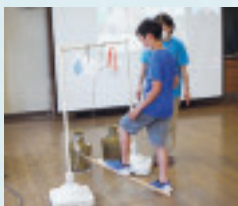
札幌市立西野小学校