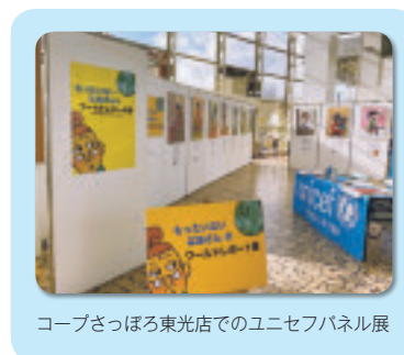
コープさっぽろ東光店でのユニセフパネル展

今、このコロナ禍の中で大雪アリーナで行われる、「食べる・たいせつフェスティバル in 旭川」と明星中学校によるハンドインハンドの買物公園街頭募金など中止となってしまいました。早くコロナが終息することを願いながら、皆様にユニセフを知っていただくよう活動を行っていきたく思います。