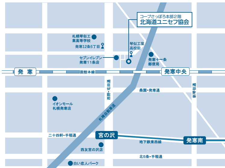
・地下鉄宮の沢駅より 徒歩20分 ・JR発寒中央駅より 徒歩10分