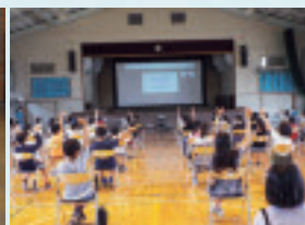
札幌市立発寒東小学校