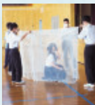
千歳市立千歳高校